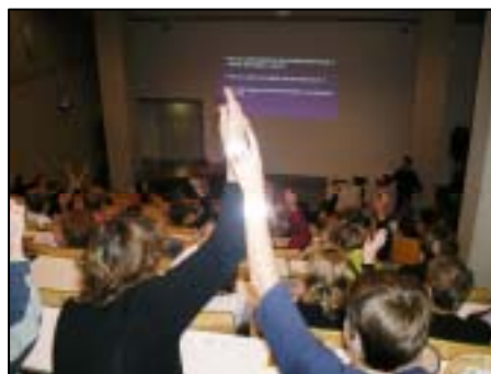
Kennisflits Leiden 'stamceltherapie'