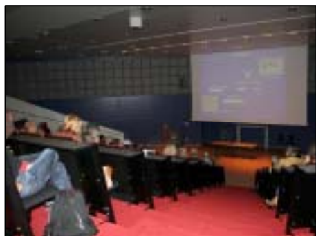
Kennisflits Amsterdam 'weefselkweek'

In de Wetenweek (oktober 2006) heeft het Erfocentrum in lijn met de informatie op www.biomedisch.nl en met medewerking van de betrokken wetenschappers een serie lezingen door topwetenschappers (Kennisflitslezingen) georganiseerd. De onderwerpen die aanbod zijn gekomen zijn vogelgriep (Rotterdam), stamcellen (utrecht en Leiden), gentherapie (Rotterdam en Leiden) en de kweek van huid (Amsterdam). Deze bijeenkomsten zijn zeer goed bezocht.